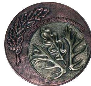
Évente három vadásztárs kaphatja meg a Veszprém megye Vadgazdálkodásáért kitüntetést

Az alapítvány célja a Veszprém megyei vadászati tájegységek környezetvédelmének és természetvédelmének segítése, ismeretterjesztő előadások szervezése és kiadványok készítése, szakmai oktatóprogramok, gyakorlatok szervezése. Az alapítvánnyal elő