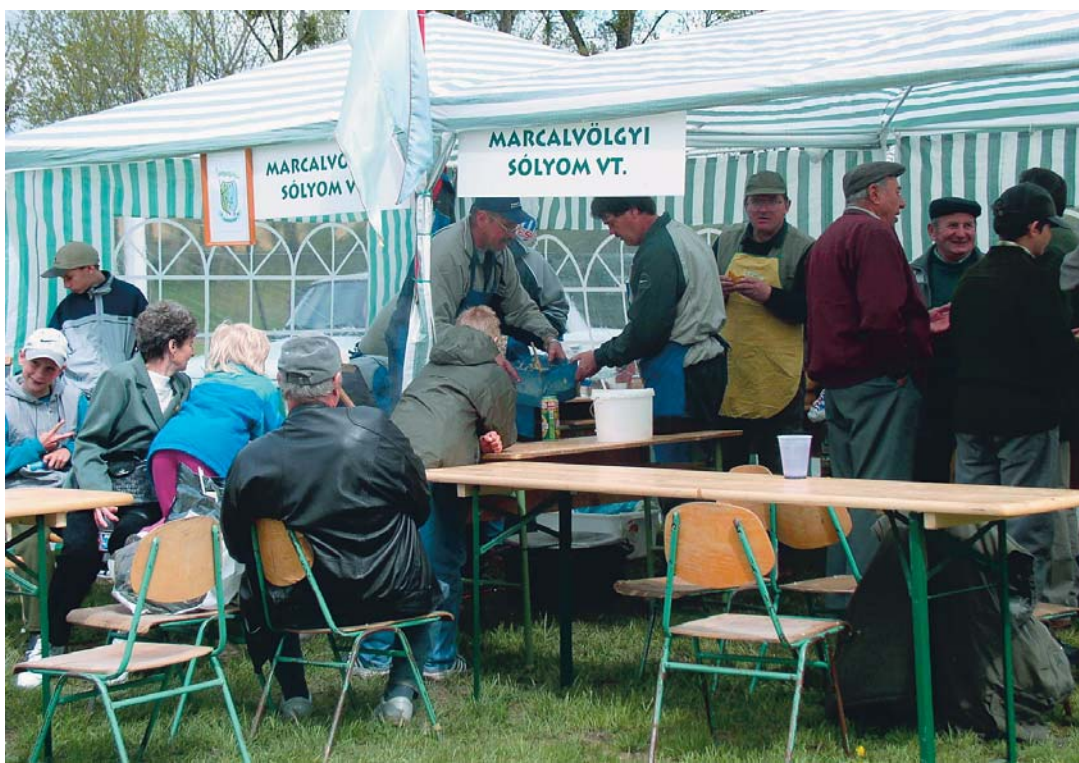
Évek óta legnagyobb sikerrel a vadászok főzőversenye zajlik. Ezúttal 14 vadásztársaság kínálta a jobbnál jobb étkeket

Ahogy azt már korábban megszoktuk, a legnagyobb érdeklődés ezúttal is a főzőversenyt övezte, amelyre 14 vadásztársaság nevezett. Szinte mindenféle vad került a kondérokba. Győztest nem hirdettek, hiszen mindegyik szakácscsapat kitétt magáért, ezért egy serleggel térhetek haza. Az eredményt a „kóstoló bizottság”, vagyis a látogatók díjazták, azzal, hogy az ételeket mind egy szálal elfogyasztották. Egészségükre!