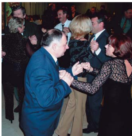
A Rulett együttes szolgáltatta a talpalávalót

zogni. A „táncparkett” az első taktusokra megtelt, a vendégek lankadatlan figyelemre készítették a Rulett együttes