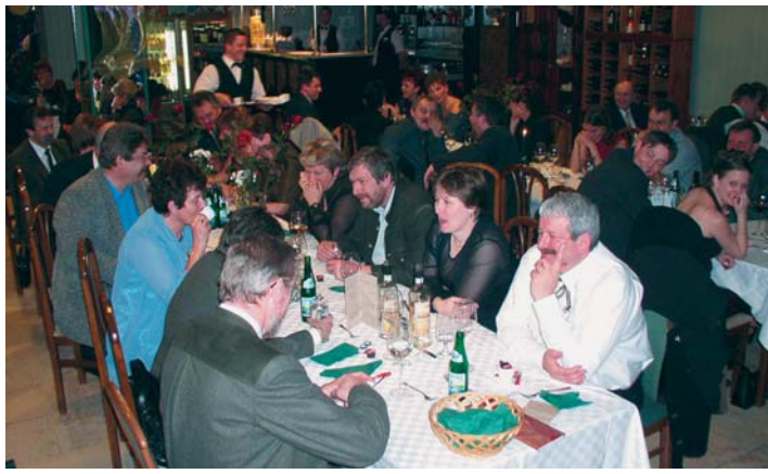
A veszprémi Hemo Étterem ismét zsúfolásig megtelt. Emelkedett hangulatban töltötték az éjjelt a vadászok

Egyre nagyobb a híre van a Veszprém megyei Vadász-kamara által megszervezett vadászballnak. Erre a rangos eseményre már nemcsak a vadásztársadalom, hanem civilek is „fenik a fogukat”. Nem véletlenül, hiszen ilyenkor minden adott ahhoz, hogy az emberek, illetve a párok kapcsolódjanak, jól szórakozzanak, s maguk mögött hagyják az elmúlt év bűjt-baját. Persze akinek ilyenkor is elmélni, megbeszélni van kedve, egy eldugott sarokban ezt is megteheti.