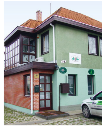
Kívül-belül megújult a kamarai székház

Az elnök leszögezte, mindezekkel a lépésekkel megteremtették a kamarai anyagi bázisát, a korszerű munkavégzés lehetőségét, valamint a kamarai tagok által igényelt szolgáltatások biztosítását. Miután a bázis adott, a következő években a szakmai munkára kívánunk nagyobb hangsúlyt fektetni. Ha tagok ezután is úgy állnak a szervezet mögött, mint tették ezt eddig, akkor továbbra is szép jövője lesz a Veszprém megyei vadász-kamarának.