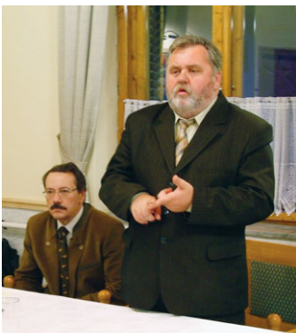
A vadászati fórum fővédnöke Gógös Zoltán volt (jobbján Pap Gyula vadász-kamarai elnök)

A Veszprém megyei Vadász-kamara vadászati fórumának fővédnöke Gógös Zoltán volt. Az FVM államtitkára kifejtette, a vadászatnak komoly szerepe van természetvédelemben, turisztikában, sportban. Az erdők védelme érdekében fontos feladat hárul a vadászokra, hiszen ők tartózkodnak legtöbbit a területen. Sokan művelik, s értékes tevékenységet vé-