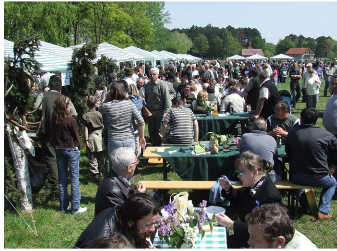
Különleges trófeákat mutattak be a vadásznap kiállításon

Idén is zajos sikert aratott a Veszprém megyei vadásznap, amely a pápai Szent-György-napi Agrárrepxo szertő részért vált az elmúlt években, sőt – bátrán kijelenthetjük – a rendezvény leglátogatottabb eseménye.