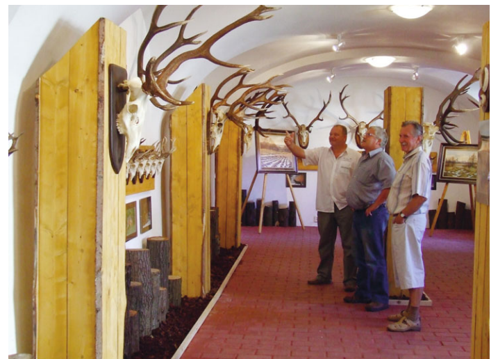
A megye második állandó trófeakiállításának a sümegi püspöki palota ad otthont