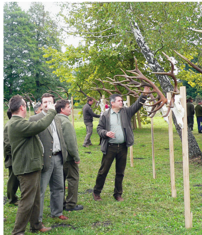
Szemre igencsak tetszetős volt a több, mint 100 trófea

Mindezek mellett szeptemberben 160 szarvasbika került terítékre, ugyanannyi, mint tavaly. Ugyanakkor megfigyelhető az átlagsúlyok gyarapodása. Míg 2005-ben 5,6-, 2006-ban 5,8-, 2007-ben hat kilogramm volt a trófeák átlagsúlya, ez az idén 6,1-re emelkedett, ami örvendetes. Szintén jónak mondható az érmesek 40 százalékos aránya. 20 darab nyolc-, kilenc darab kilenc-, és három darab tíz kiló feletti bikájuk volt. A legnagyobbak: 10,4 (Monostorapáti), 10,39 (Farkasgyepű), 10,33 (Devecser). Megfigyelhető a hazai vendégvadászok térhódítása, a két legnagyobb bikát is magyarok ejtették. Az éves tervek 284 bika, amiben természetesen a selejtezés is szerepel. Ma úgy látszik, a terv teljesítése nem ütközik nehézségekbe.