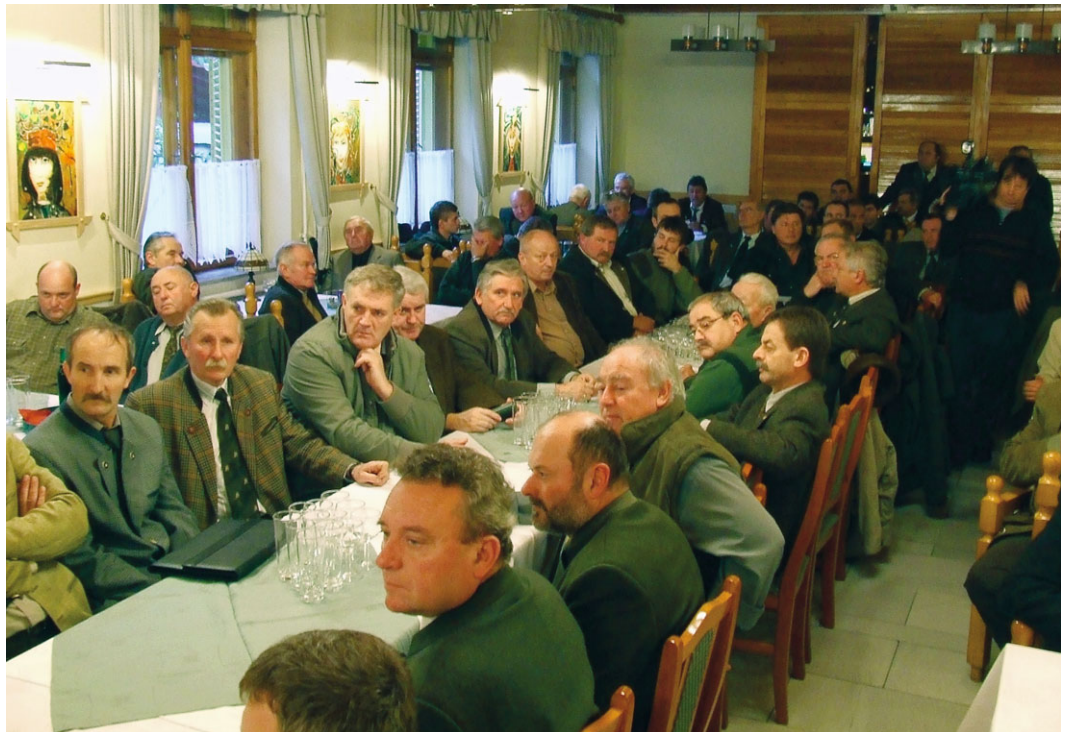
Az elhangzottak nagy érdeklődést váltottak ki

Az elnök örömeinek adott hangot, hogy idén már ismét a komoly szakmai munka került előtérbe, így a megye vadásztársadalma visszanyerte vezető helyét. A vadgazdálkodási tevékenység terén az országban a harmadik-negyedik helyen jegyzik megyénket. Szerinte akár még jobb eredményeket is tudnának produkálni, de csak a 2400 kamarai taggal együttesen. A közös célokért érdemes tenni, áldozatokat hozni.