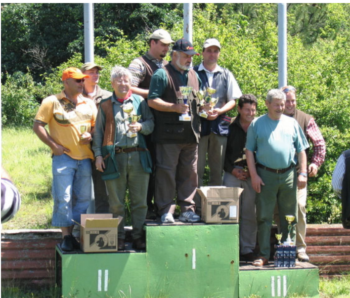
Egyéniben és csapatban is szertő eredményt hozott a verseny

Ma már nagyon komoly rangja van a Vadászkamarai Nagydíj lövészversenynek, amit bizonyít az évek óta tartó fokozott érdeklődés. Idén egyéniben és csapatban is szertő eredményt szertőtt.