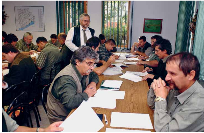
Nagy érdeklődéssel zajlott a tanfolyam a kamaránál

munkája, tevékenysége elengedhetetlenül szükséges az elsődleges húsvizsgálatot végző hatósági állatorvos fogyasztóhatósági döntéséhez. Ennek a tevékenységnek a dokumentálása az úgynevezett vadkísérő