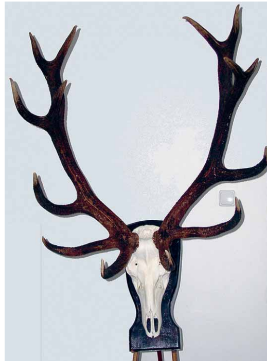
Az idei megyei rekord trófea

Uzsán 15 év után megdőlt a vadászársági rekord, nem is akárhogyan. A rekord agancs az idei év legnagyobb megyei trófeája is lett egyben. Egy, a HM Budapesti Erdőgazdaság uzsai erdészetének évek óta visszajáró vendége volt az, aki a rekord bikát elejtette.